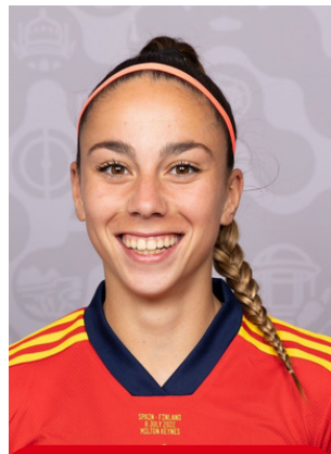
ATHENEA DEL CASTILLO

Fútbol - Jugadora de la selección española y delantera en el Real Madrid de la Primera División Femenina y. Campeona del mundo 2023.