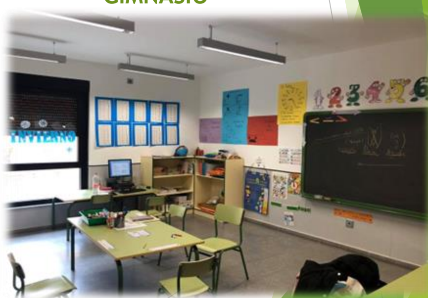
AULA DE PT Y AL